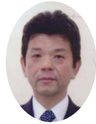
雄和市民サービスセンター